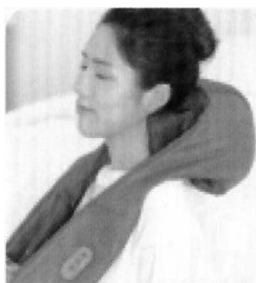
Плечи и шея

Данный продукт предназначен для разных частей тела, особенно эффективно его воздействие проявляется на плечах, шее, пояснице и ногах.