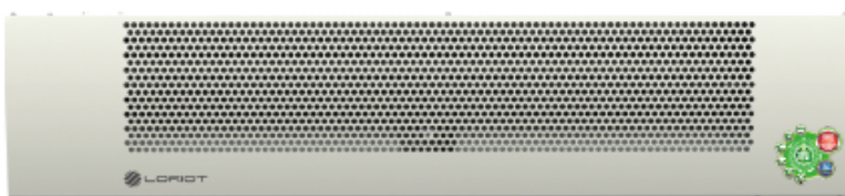
LORIoT LTZ-6.0 T