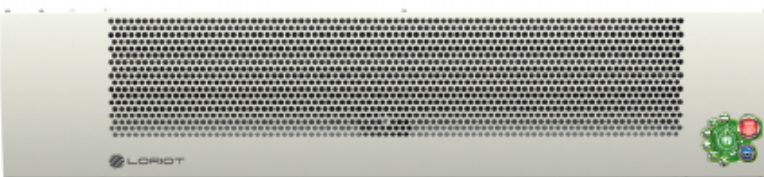
LORIoT LTZ-6.0 T