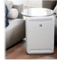
Воздухоочистители (мойки воздуха)