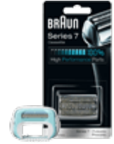
Аксессуары к бритвам и эпиляторам