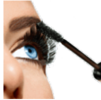
Тушь для ресниц