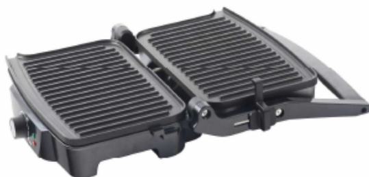
Открытие панелей на 180°