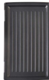
Размер 1 панели 29.7x23.5 см